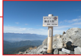
いきなり登りたくなくて登った仙丈ヶ岳