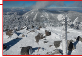
Mさんに写めしたら気に入って携帯の待ち受けに使ってくれました