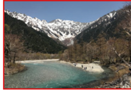
絶景すぎるTHE 上高地の景色。この時、なぜか焼岳は眼中になかった

⚠️母と川俣東沢渓谷遊歩道を歩き遭難未遂(3時半から歩き出したため途中で日没に...)