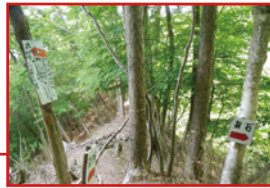
↑ここをまっすぐ行ってしまった。迷う人が多かったのか、現在は標識が付けられている