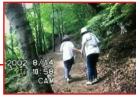
こんななんでもない道で(´Д`)ビビって母に手をひかれる29才の私。コドモかつ