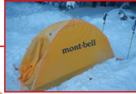
初めての雪山テント設置は2時間ぐらいかかった... バカすぎ