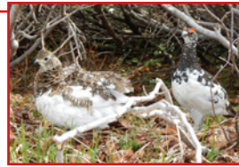
6月は繁殖期、恋の季節です