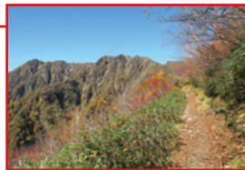
絶景で歩きやすいが当時は怖かった。この後しばらく崖から落ちる夢ばかり見た

⚠️水を500mlしか持っていかず種池山荘で買う勇気?もなく死にかけた(死なないうけど)