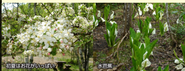
初夏はお花がいっぱい