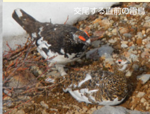
交尾する直前の雷鳥