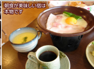
朝食が美味しい宿は本物です