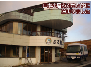
山本小屋ふるさと館に泊まりました