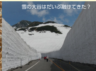
雪の大谷はだいが融けてきた?