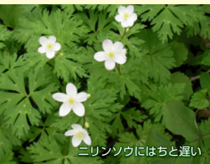
ニリンソウにはちと違い