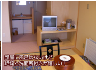
部屋に風呂はないけど炬燵と洗面所付きが嬉しい!