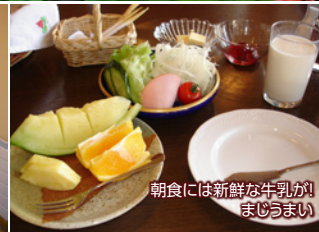
朝食には新鮮な牛乳が! まじりまい