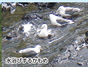
水浴びするかもめ