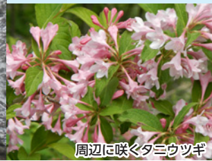
周辺に咲くタニウツギ